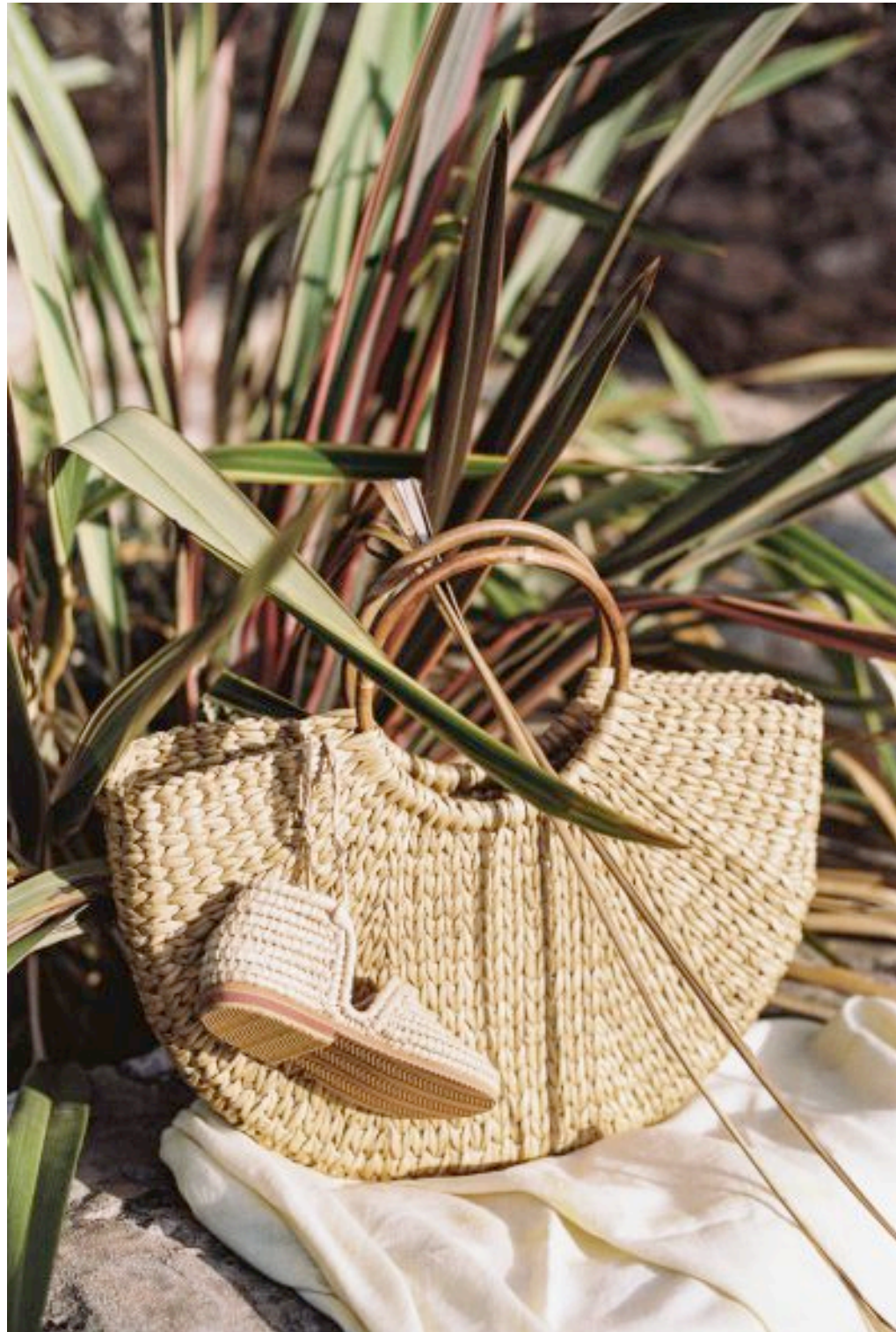
Sac Fabric Hunted & Collected . Sandale BonMot .